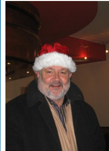
Le Père Noël existe, nous l'avons tous reconnu, c'est le caissier de Vivre La Chaux-de-Fonds !

Vivre La Chaux-de-Fonds n'est pas qu'une association, c'est également et surtout une multitude de personnalités convaincues par les visions et les buts que nous poursuivons. Au travers de cette colonne, nous désirons faire mieux connaissance avec chacun d'eux, membre du comité ou soutien influent de commission, de manière aléatoire, toutes et tous aurons l'honneur, en quelques mots, de soutenir leur démarche au sein de Vivre La Chaux-de-Fonds.